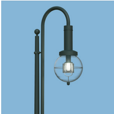
URBI 1 Gehwegkandelaber mit URBI – Mast.

Leuchtengehäuse aus Aluminiumguss, Aluminium, Edelstahl, Schrauben Edelstahl, Funktionsgewinde mit Edelstahl-Einsatzbuchsen, zweiteilige Kugel PC klar, MTR 201-Refraktor, Ø: 500mm, H: 1020mm, Schutzart IP54, Schutzklasse I, optional Schutzklasse II, inkl. konischer URBI Systemlichtmast aus feuerverzinktem Stahl mit Fußplatte, □ 350mm 2 x 25mm, mit URBI Befestigungspunkten in 3 Ebenen, feuerverzinktes Stahlbogenrohr Ø: 60mm als Sekundärträger fixiert, lackiert, zweiteilige Sockelverkleidung und Abschlussku-